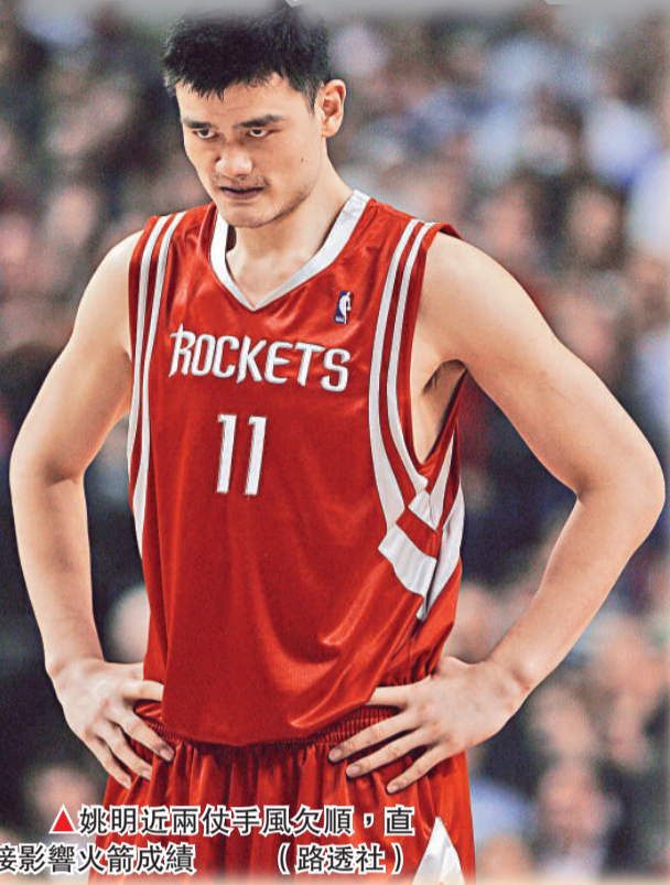
▲姚明近兩仗手感風順，直接影響火箭成績