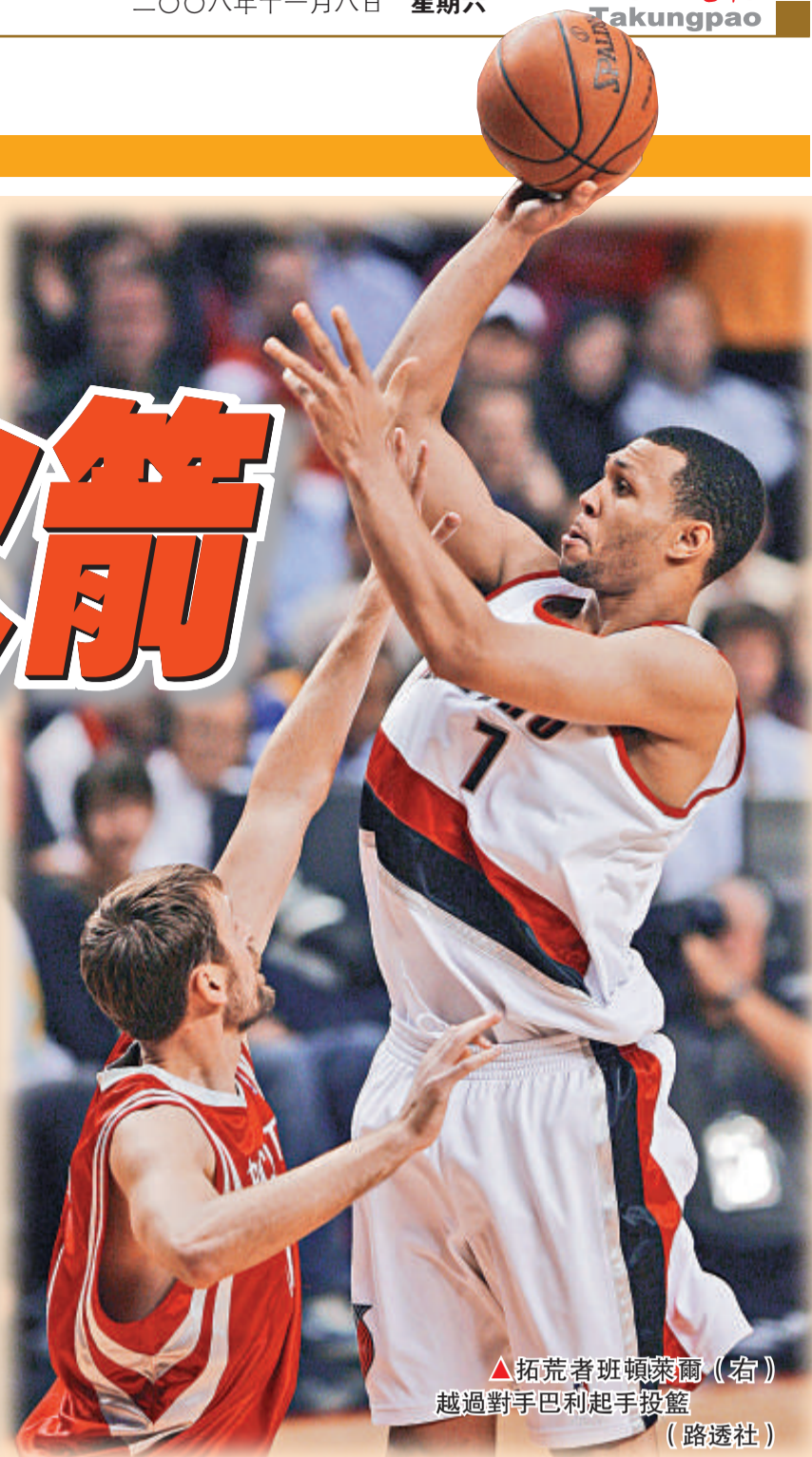
▲拓荒者班頓萊爾(右)越過對手巴利起手投籃